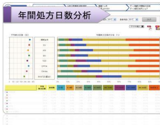
JMIRI ウェブ処方インサイト Adherence のサービス画面イメージ